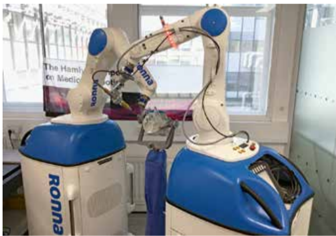
Robot sa zagrebačkog FSB-a

Poslovno gledano, iduća ključna stvar je certifikacija, znači dobivanje CE certifikata, pri čemu je najveći problem pronaći partnera za certifikaciju RONNE. U Hrvatskoj nema proizvođača medicinske opreme, a to ne možete bez takve kompanije. Certifikacija traje dvije do pet godina i ona je pravno-tehničko pitanje. Veliki interes za suradnju pokazali su prošle godine brojni partneri na najvećem sajmu medicinske tehnologije u Düsseldorfu, a isto tako i sada u Londonu. Štoviše, nagrada koju smo dobili u Londonu izazvala je veliki interes potencijalnih partnera tako da se nadam da ćemo u dogledno vrijeme imati partnera za certifikaciju iz EU.