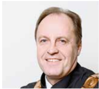
PIŠE PROF. MILJENKO ŠIMPRAGA, PROREKTOR SVEUČILIŠTA U ZAGREBU

Dok razvijene države povećavaju svoja proračunska ulaganja u obrazovanje odraslih, Hrvatska je nakon donošenja Zakona o obrazovanju odraslih ta proračunska sredstva smanjila. Stoga ne čudi da se od 2004. godine nismo pomakli od 2,4 posto odraslih (starijih od 15 godina) koji sudjeluju u bilo kojem procesu učenja, dok je u najrazvijenijim europskim državama takvih osoba i do 30 posto.