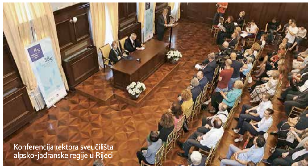
Konferencija rektora sveučilišta alpsko-jadranske regije u Rijeci

Projekt "Kompleks studentskoga doma Sveučilišta u Dubrovniku" financira se iz bespovratnih sredstava u okviru Operativnog programa Konkurentnost i kohezija, unutar Poziva na dostavu projektnih prijedloga: Modernizacija, unaprjeđenje i proširenje infrastrukture studentskog smještaja za studente u nepovoljnom položaju. Ukupna vrijednost projekta je 216.122.675 kuna, a bespovratna sredstva iz Europske unije dodijeljena su u iznosu od 150.900.000 kuna. UNIDU.HR