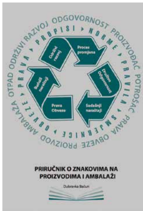
Slika 2: Priručnik o znakovima na proizvodima i ambalaži