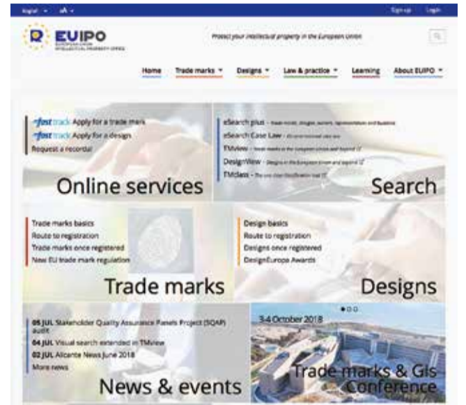
Slika 4: Web stranica europskog ureda za intelektualno vlasništvo