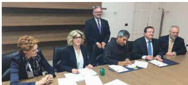
Potpisivanje Memoranduma o razumijevanju između sveučilišta u Zagrebu i Mostaru i rimskog Antonianuma

veleposlanica Bosne i Hercegovine i Carlos Avila Molina , izvanredni i opunomoćeni veleposlanik Hondurasa. Veleposlanici su posebno zahvalili izaslanstvu Sveučilišta u Zagrebu na iskazanom interesu za teme integrativne ekologije koja uključuje ne samo prirodno-ekološke probleme suvremenog svijeta, već i društveno-ekonomske, što i znanstvena zajednica danas sve više prepoznaje kao važno znanstveno uporište.