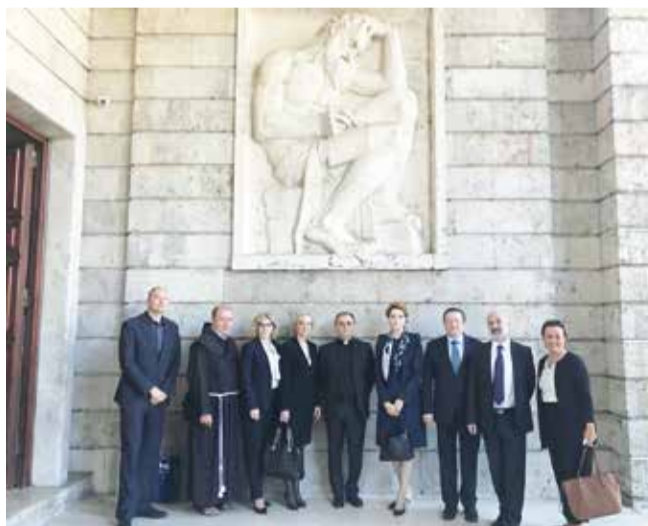
Izaslanstva sveučilišta u Zagrebu i Mostaru u Zavodu svetog Jeronima u Rimu