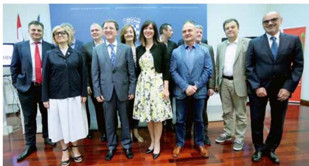
Potpisnici ugovora i budući korisnici HR-ZOO-a

Mnogo je manje sigurnosti nego su imali bake i djedovi današnjih studenata, koji su jedva promijenili u svom životnom vijeku dva do tri radna mjesta, a baš rijetko mijenjali profesiju. No, današnji studenti bit će sigurniji u sebe i kompetentniji od svojih roditelja za koje se svijet promijenio, ali nisu imali vještina da tu promjenu svladaju.