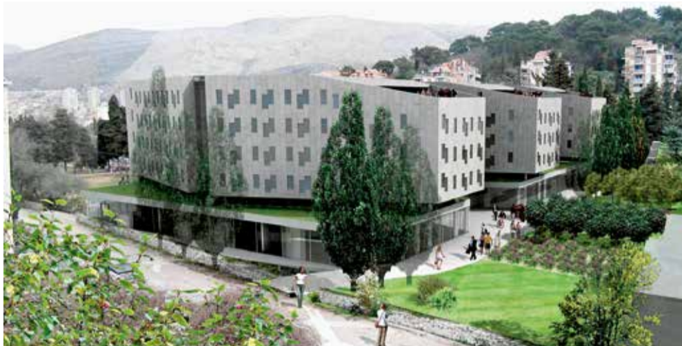
Projekt budućeg studentskog doma u Dubrovniku