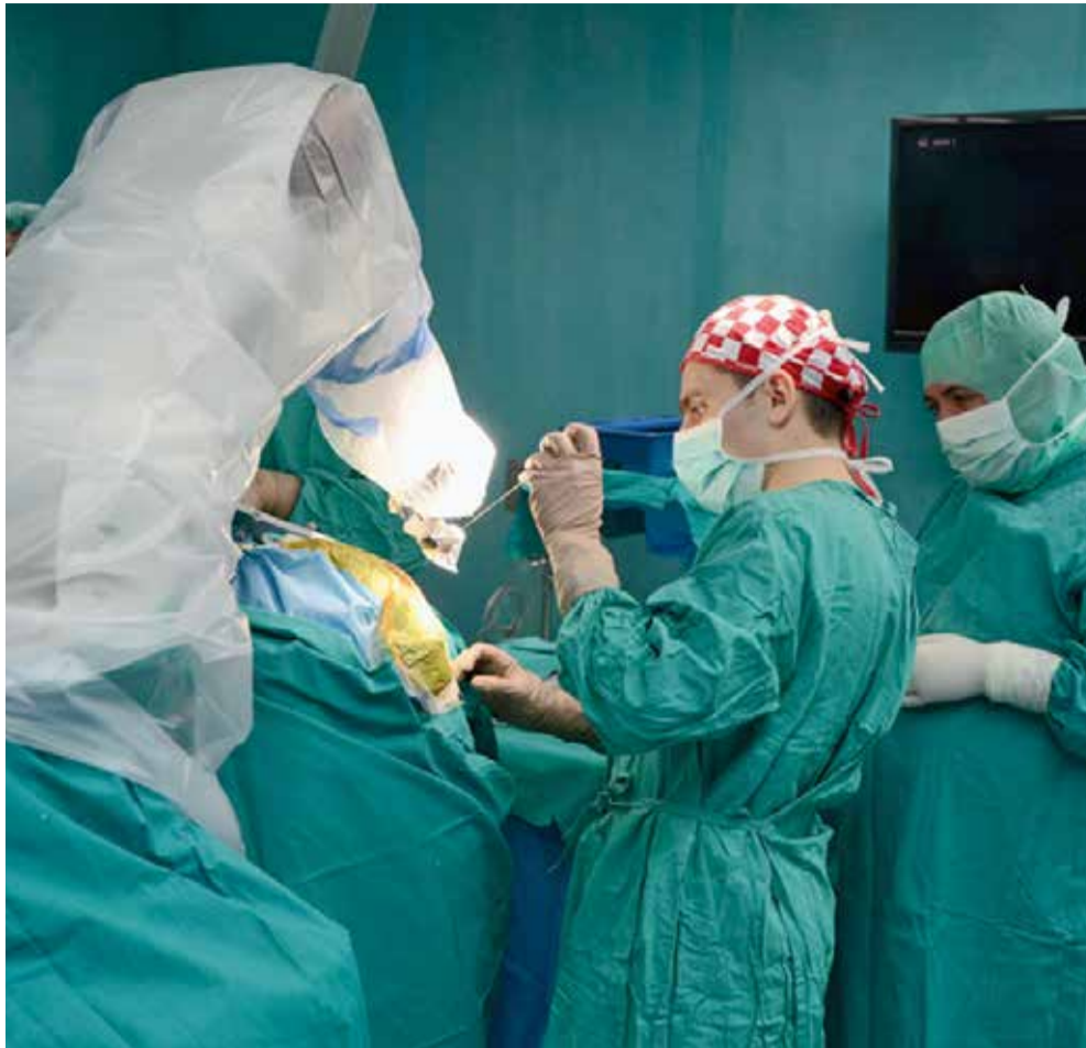
Neurokirurška operacija uz pomoć robota Ronne

Tijekom razvoja neurokirurškog sustava RONNA susreli smo se s mnogim problemima, no jedan od najvećih problema je tzv. "inverzna kinematička greška" koja proizlazi iz klasične robotske konfiguracije. Zato razmišljamo o primjeni jednostavnijih robotskih struktura koje uzrokuju greške nižeg reda. U suradnji s dr. Chudyjem oblikovali smo ideju novog robotskog sustava koji odgovara specifičnim kliničkim zahtjevima. Tako je nastao novi projekt NERO. U sklopu tog novog projekta želimo razviti robot vlastite konstrukcije koji bi trebao biti precizniji i kompaktniji od RONNE. Savršenog partnera za taj projekt našli smo u tvrtki INETEC, svjetski poznatom proizvođaču robota za inspekcije nuklearnih postrojenja, a čiji tim predvode dr. sc. Ante Bakić i dr. sc. Ante Buljac. Zahvaljujući novim sredstvima otvoreno je 12 novih istraživačkih radnih mjesta koja okupljaju na jednome mjestu inženjere strojarstva, računarstva, fizike i profesorice psihologije. Tako je na projektu NERO u sve tri partnerske institucije INETEC-u, FSB-u i KBD-u zaposleno 25 istraživača, što je u odnosu na ljudski potencijal kojim smo raspolagali tijekom razvoja RONNE četiri puta više. Mladi istraživači pomno su odabrani i već sada pokazuju iznimne doprinose u razvoju projekta.