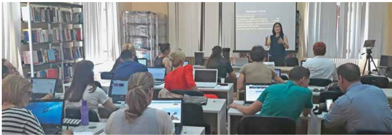
Radionice o programu učenja na daljinu u Osijeku