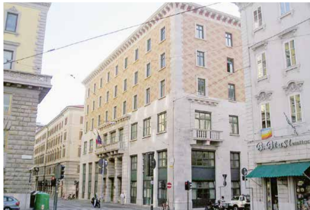
Zgrada Narodnog doma u Trstu, sjedište SSLMIT-a

Što se pak "tajnog recepta" tiče, sve su tajne jasno obznajene u simbolima nad ulazom u zgradu Narodnog doma u ulici Filzi u kojem je ova ustanova smještena: košnici s pčelama!