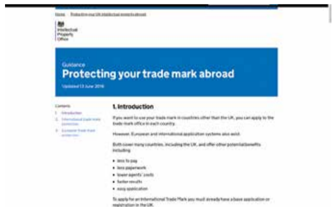
Slika 3: Web stranica Ureda vlade Ujedinjenoga kraljevstva za intelektualno vlasništvo