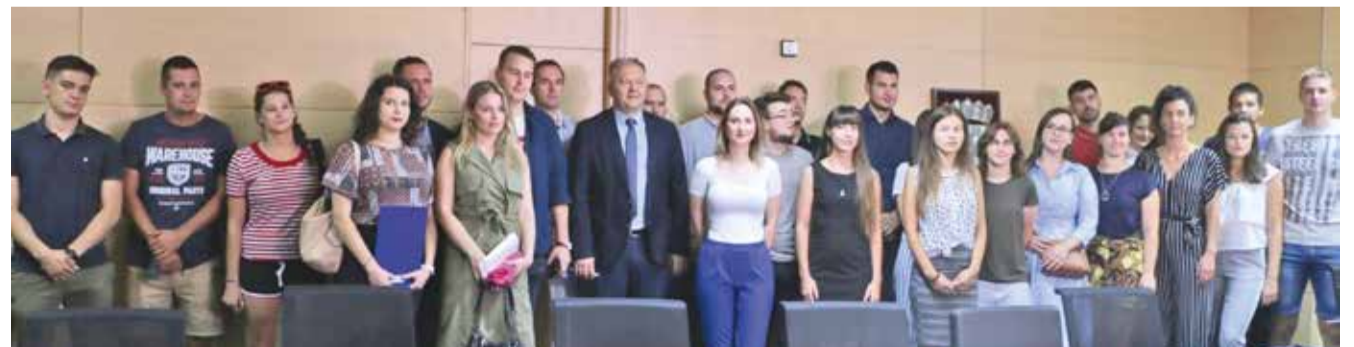
Dobitnici sredstava za realizaciju studentskih projekata