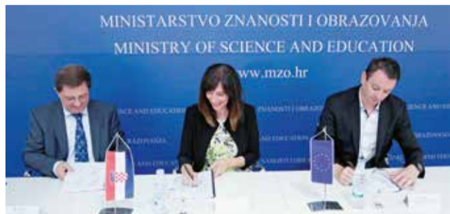
Potpisivanje ugovora o dodjeli bespovratnih sredstava za Hrvatski znanstveni i obrazovni oblak

Svrha i glavni cilj projekta Hrvatski znanstveni i obrazovni oblak (HR-ZOO), za koji je Ministarstvo znanosti i obrazovanja osiguralo gotovo 200