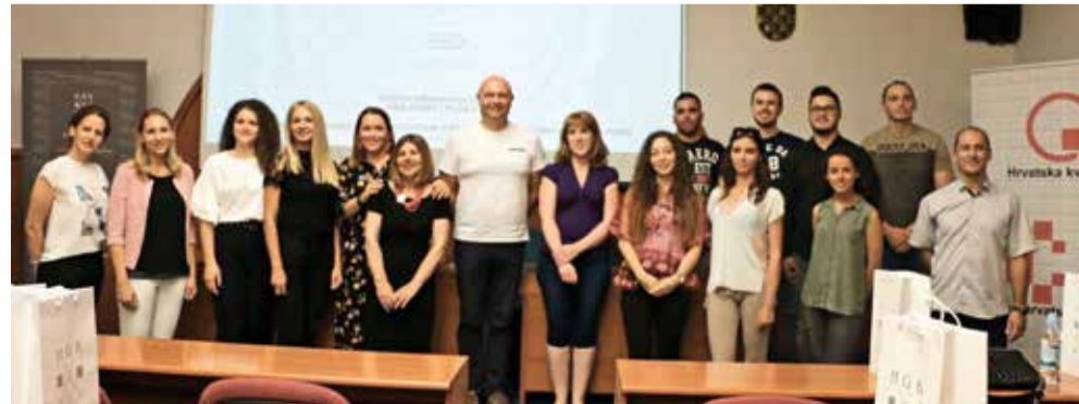
Nagrade HGK studentima Sveučilišnog odjela stručnih studija u Splitu

Nagrade studentima za WebStart projekt, koji podrazumijeva studentsku izradu web-stranica, uručio je mr. sc.