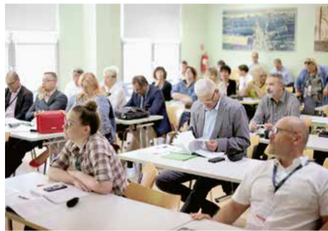
Sudionici jedne od rasprava na Kongresu

Glavni ciljevi Kongresa bili su: ponovno uspostavljanje ministarstva iseljeničtva, razvijanje i stabiliziranje dugoročne javne politike Republike Hrvatske prema iseljenicima, animiranje znanstvenika i gospodarstvenika na suradnji s hrvatskim iseljenicima, poticanje svijesti o potencijalu hrvatskih iseljenika