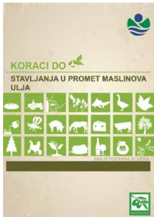
Slika 1: Priručnik Koraci do stavljanja u promet maslinovog ulja

Iznimno kvalitetno i čitko zakonodavstvo ima Velika Britanija, koja na vladinim stranicama www.gov.uk ima objavljene lako razumljive brojne upute, a također i uslugu pomoći korisniku pri tumačenju zakonodavstva (Sl. 3). Nešto manje kvalitetnu interakciju postiže EU na web sjedištu EUIPO European Union Intellectual Property Office , jer su web pravni sadržaj prezen-