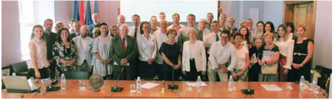
Sudionici skupštine saveza udruge alumna zagrebačkog sveučilišta

Nazočne je podsjetio i na to da je Savez u veljači organizirao dobro posjećeno predavanje izv. prof. Davora Lauca "Kako pronaći i privući bivše studente u alumni organizacije" vezano