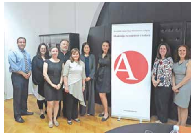
Sudionici okruglog stola u sklopu 'Dana internacionalizacije' u Osijeku

PROGRAM SVEUČILIŠTA U OSIJEKU I VIŠE AMERIČKIH INSTITUCIJA