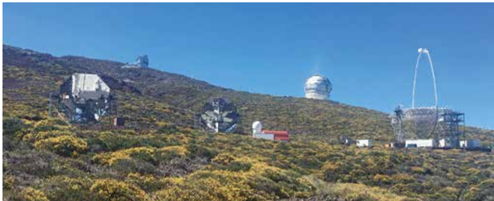
Dva teleskopa MAGIC (lijevo) i teleskop LST-1 u izgradnji na kanarskom otoku La Palma

Detektor IceCube, instaliran u 1 kilometru kubičnom kristalno čistog leda na dubini od oko dva kilometra na Južnom polu 22. rujna 2017. godine, detektirao je neutrino energije 290 TeV (energije 40 puta veće od energije protona u LHC akceleratoru)