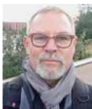
PIŠE PROF. NIKOLA GODINOVIĆ, VODITELJ HRVATSKE GRUPE

Klinička ispitivanja s RONNOM počela su u ožujku 2016. godine i RONNA do danas redovito operira s ma-