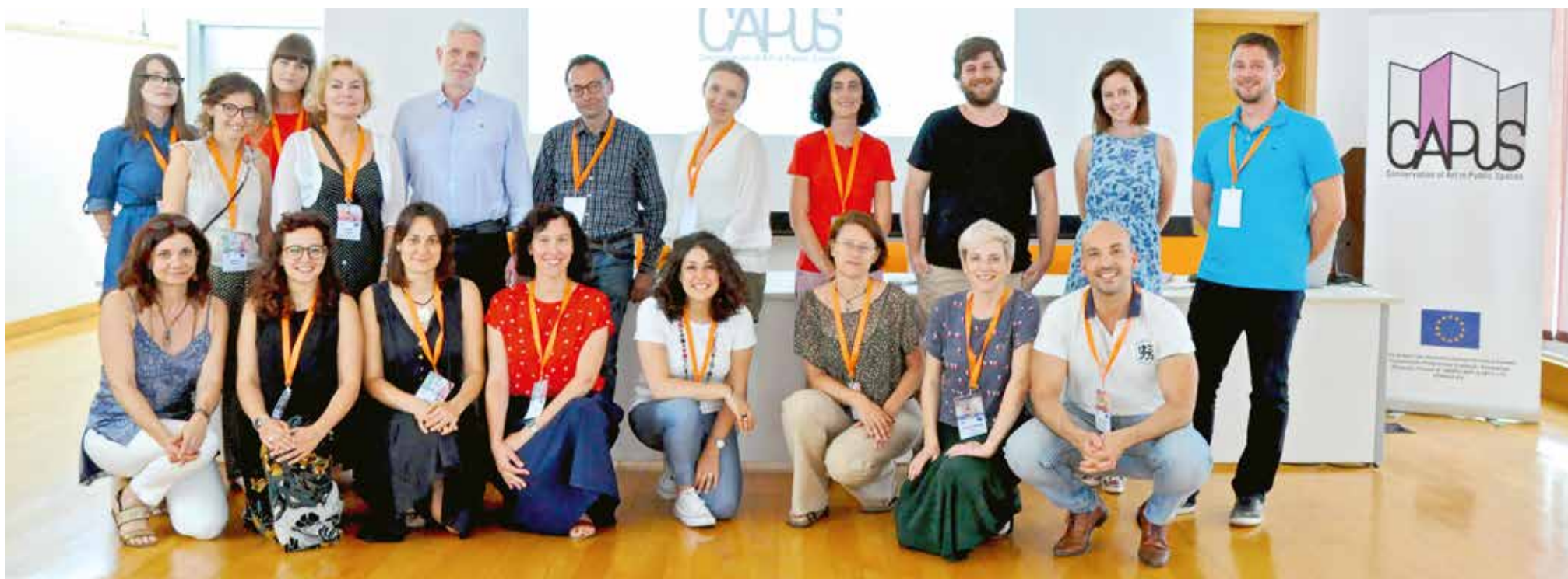
Sudionici drugog radnog sastanka projekta CAPuS u Splitu

SVEUČILIŠTE U SPLITU UGOSTILO DRUGI RADNI SASTANAK PROJEKTA CAPUS