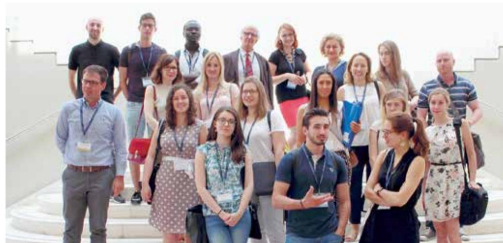
Sudionici ljetne škole na splitskoj Ekonomiji

2. "Od pametnih k inteligentnim gradovima: Koncepti, metode, digitalna transformacija", u kojem je prezentiran potencijal i važnost novih inicijativa u sferi urbanog planiranja na koje veliki utjecaj ima rapidan razvoj "smart" tehnologija te implementiranje digital-